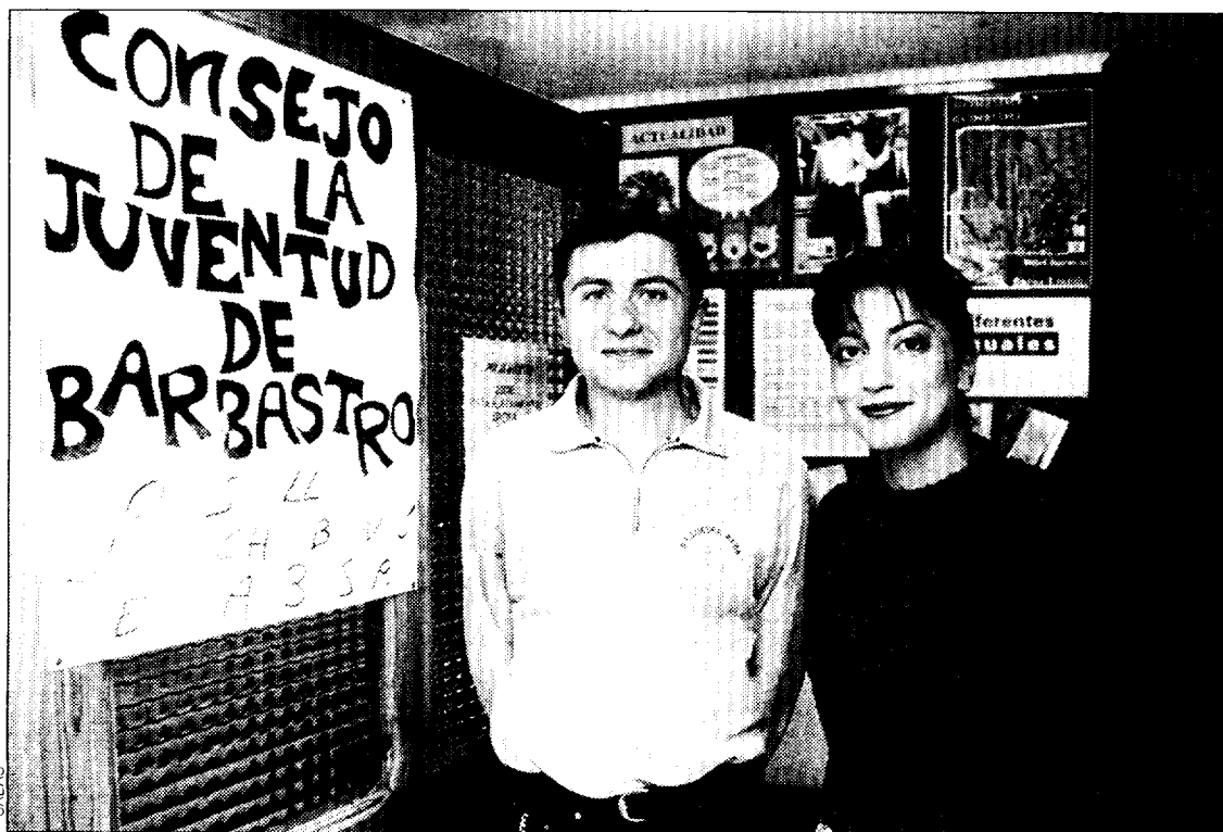
Uno de los objetivos del CJA es potenciar los consejos locales.