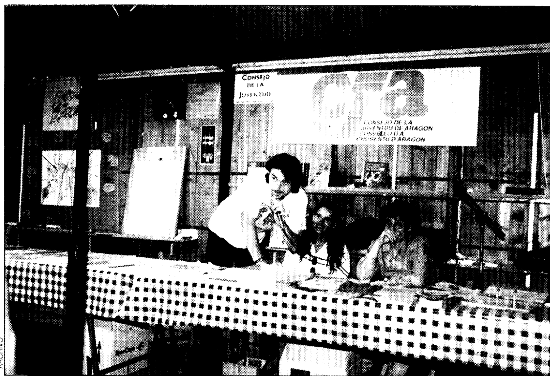
Estand del Consejo de la Juventud de Aragón en la Feria de las Asociaciones de Huesca.