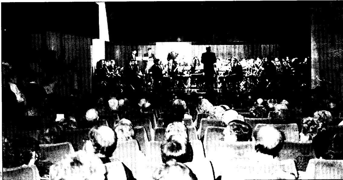
La Banda de Música actuó el día de San Vicente en el salón de actos de la DPH

En definitiva, un buen concierto que permite observar cómo la banda va aumentando su calidad instrumental y el buen hacer de los jóvenes que participan en ella, cuya práctica les lleva a superar con destreza las dificultades que cada instrumento entraña.