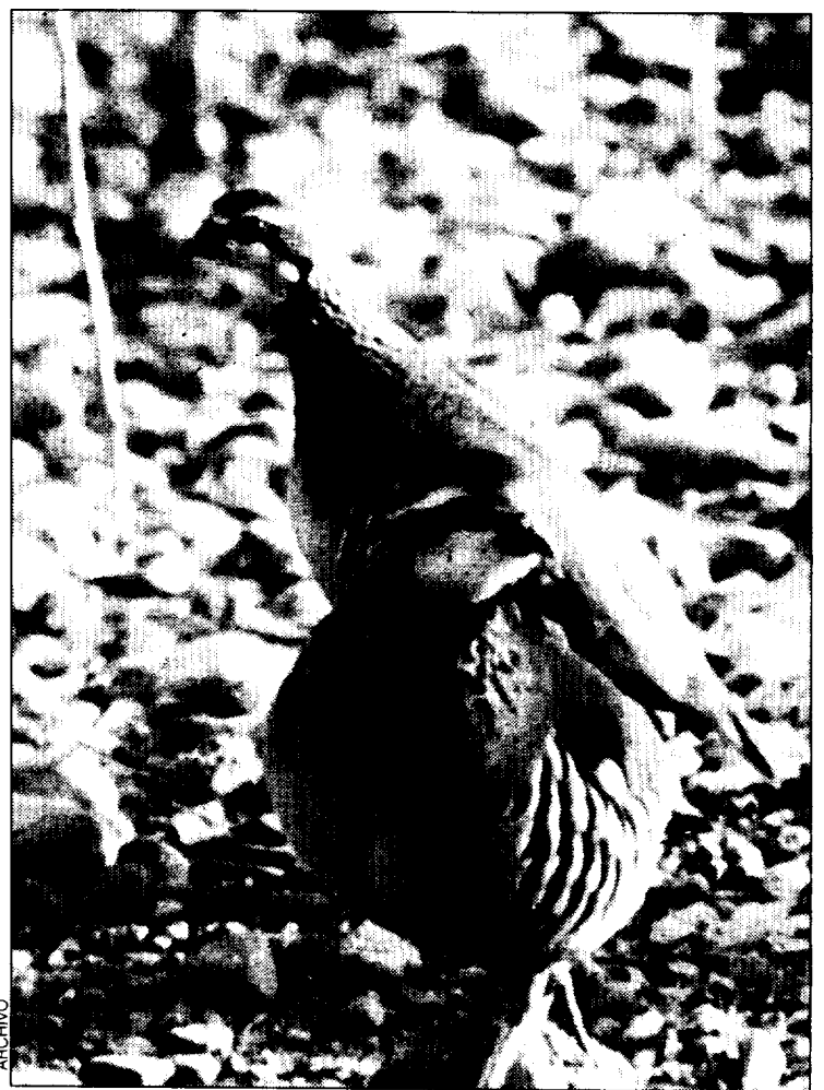
Ejemplares de perdiz.

En el prepirineo aragonés pueden dispararse además la llamada becada o chocha perdiz, especie de la que este año se han cap-