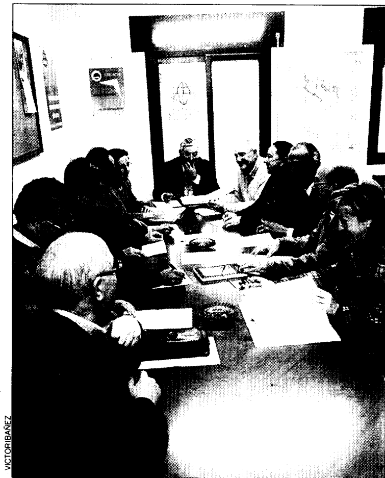
Imagen del Consejo Sindical Provincial celebrado ayer por ANPE.

En contra de la opinión que mantienen otros sindicatos, ANPE apuesta por mantener el primer ciclo de Secundaria (12 a 14 años) en las secciones delegadas y en los colegios de los pueblos. En este sentido, pide una "flexibilización" de la ESO. José María Mur también se refirió a que los centros de la provincia deben contemplar los requisitos míni-