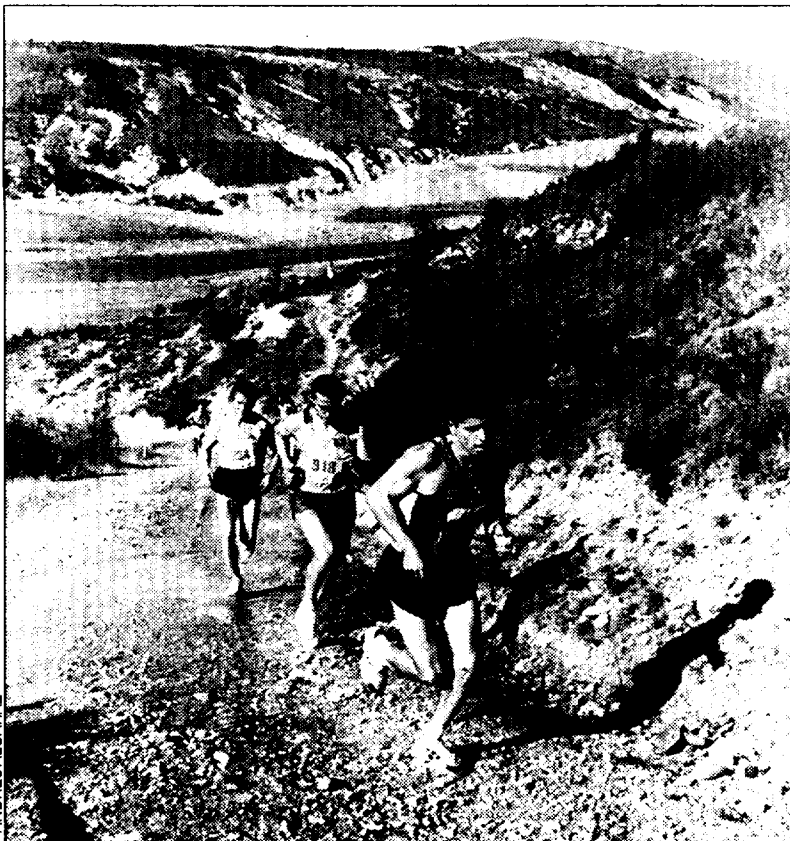
El trazado de la prueba es bastante duro y selectivo, especialmente para las categorías absolutas.