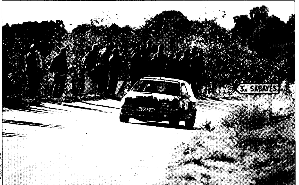
Uno de los vehículos completando el primer tramo, entre Apiés y Sabayés.

Una quincena de pilotos participaron ayer en la competición de carácter nacional