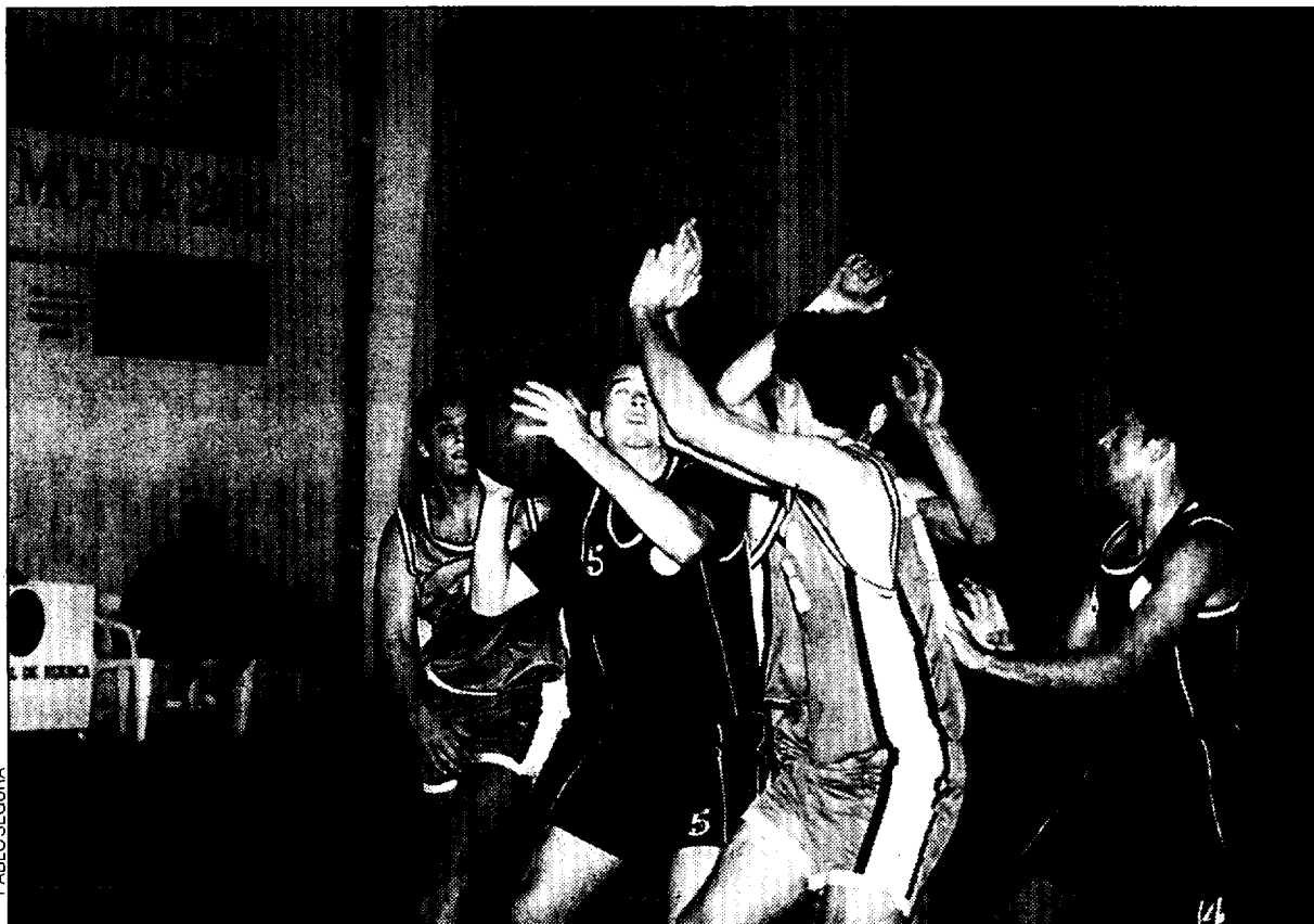
El Unión Huesca consiguió una valiosa victoria ante su público en un partido que se decidió en la prórroga.

Unión Huesca.- Lasheras (3), Bentué (16), Banzo (2), Brosed (10), Calvo (21), Alonso (10), Laplaza (28), Cabellud (9), Viñuales (-), Larruga (-) y Vallejo (-).