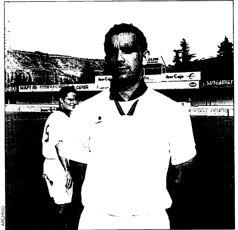
Falcón marcó ayer tres goles.

En la segunda mitad, los fragatinos se acomodaron a la espera