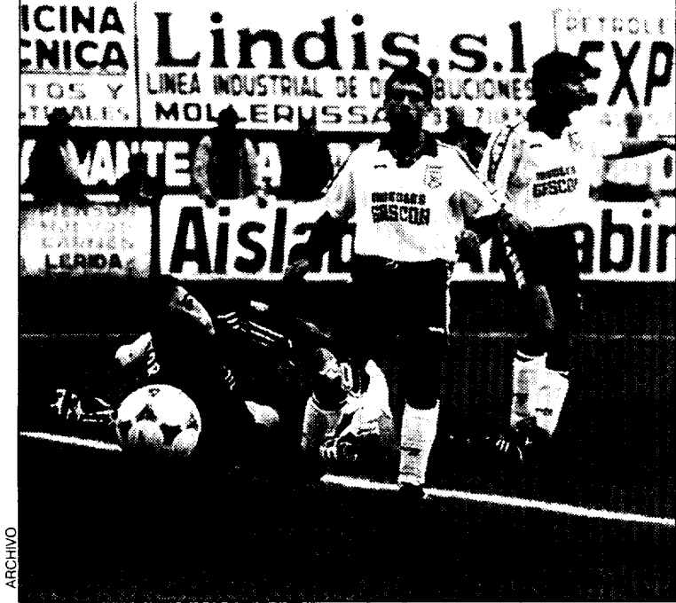
El Sariñena consiguió un punto en el campo del Teruel.