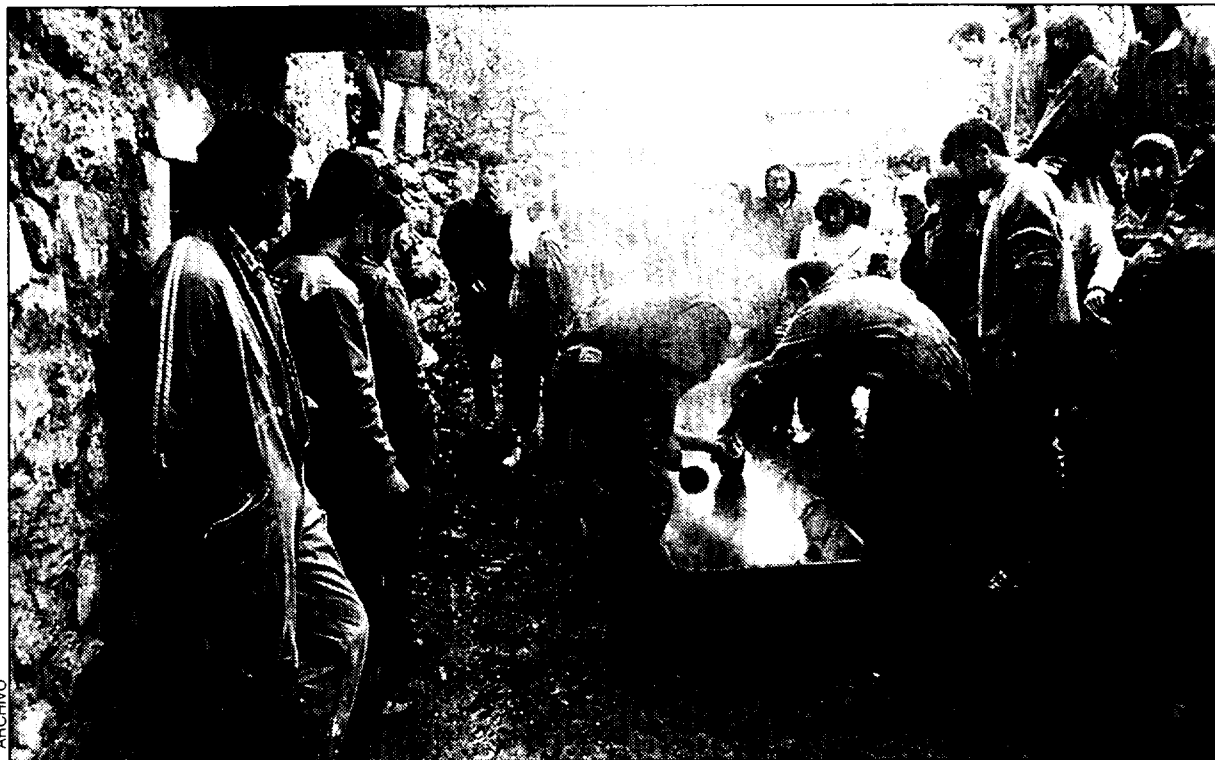
Matacía en el núcleo de Búbal.

El PSOE recuerda el éxito de iniciativas como la reconstrucción de Sieso de Jaca para centro de actividades juveniles (1980); la cesión a la asociación Altiborraín de grupos neorurales de los