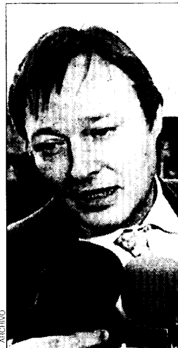
Josep Piqué, ministro de Industria

Los perjuicios experimentados por el sistema eléctrico español suponen la pérdida de capacidad de la interconexión eléctrica, muy débil en España, y la posibilidad de realizar intercambios con Francia y otros países euro-