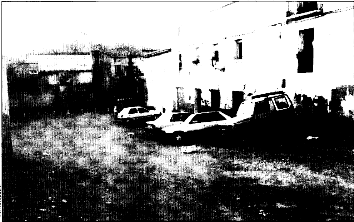
Plaza de Latre.