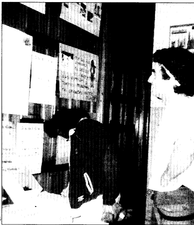
La recogida de firmas va a proseguir.

Para éstos, fue también muy importante la respuesta dada a los talleres de niños, en los que alrededor de cuarenta menores constataron con distintos juegos la situación que atraviesan otros niños de su misma edad por el