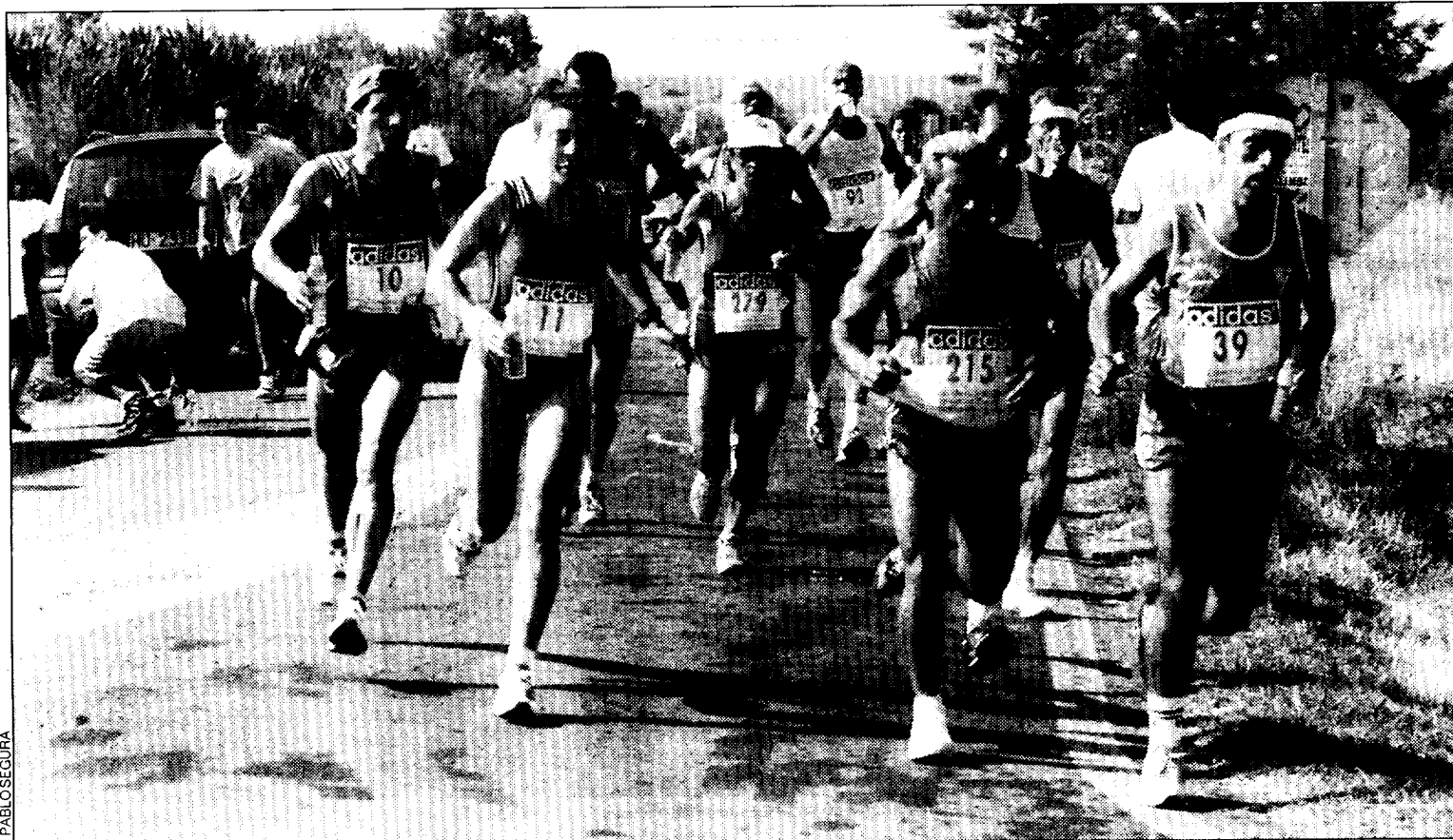
El atletismo es la principal actividad que desarrolla el club.

El presidente de la entidad advierte que “somos un club sin ánimo de lucro, tenemos nuestra financiación y contamos