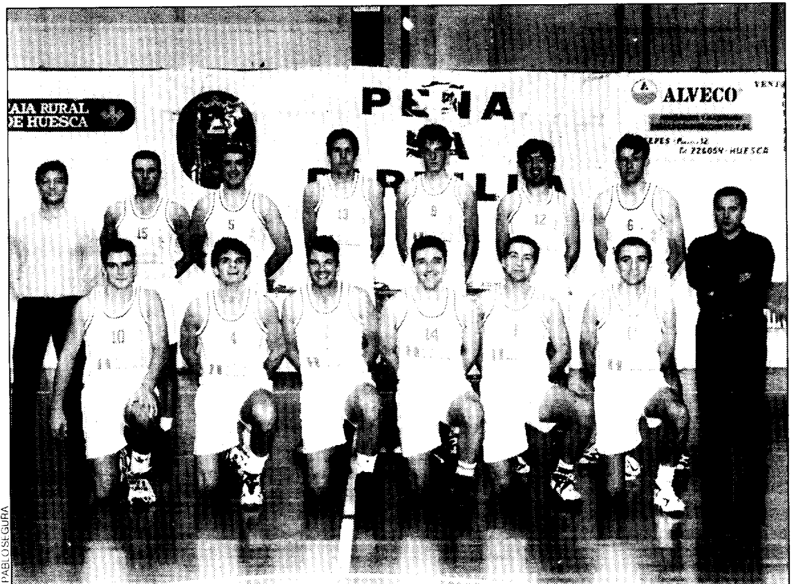
Equipo del Peña La Parrilla-Las Torres.