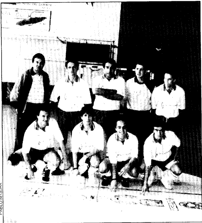
Equipo de Transportes La Guipuzcoana.

El torneo cuenta con 46 equipos en cuatro grupos