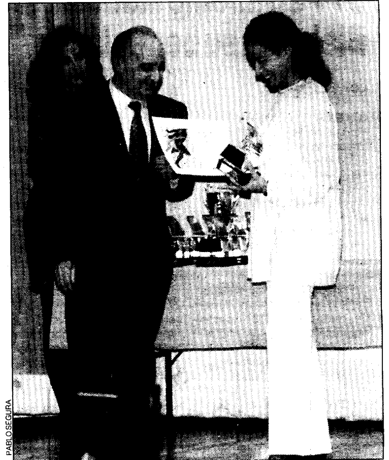
Entrega de galardones, durante la última edición del certamen.

Esta es una de las principales novedades que ofrece la muestra altoaragonesa, que se celebrará entre los días 3 y 7 de diciembre en el Palacio de Congresos de Jaca. La dirección del festival está trabajando en el diseño del programa de proyecciones después de un intenso periodo de selección que se ha prolongado por espacio de varios meses.