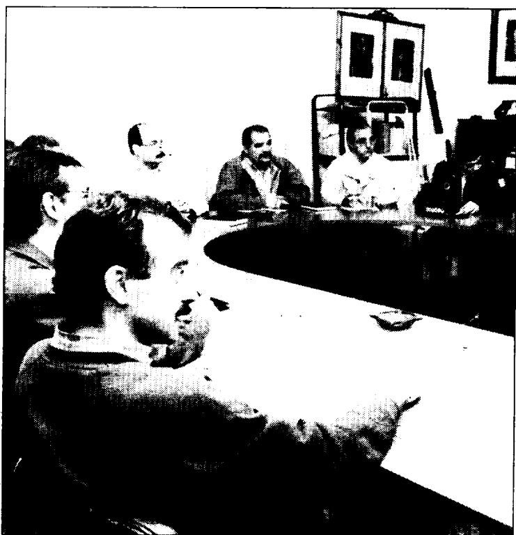
Imagen de la reunión que supuso el "arranque" del proyecto.

Las movilizaciones pretenden mostrar el rechazo de los sindicatos y los trabajadores de la Función Pública a una política de Administraciones Públicas que consideran "encaminada al desprestigio de los empleados públicos y que no busca otra cosa que el deterioro del servicio".