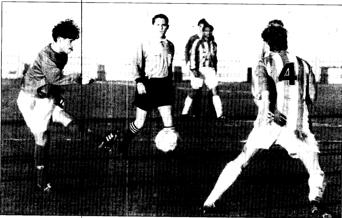
El Binéfar se mostró como un equipo muy correoso.

El Hernán Cortés atacó fuerte en los últimos minutos del primer período y se benefició con el segundo gol y la circunstancia de que los visitantes se quedaron