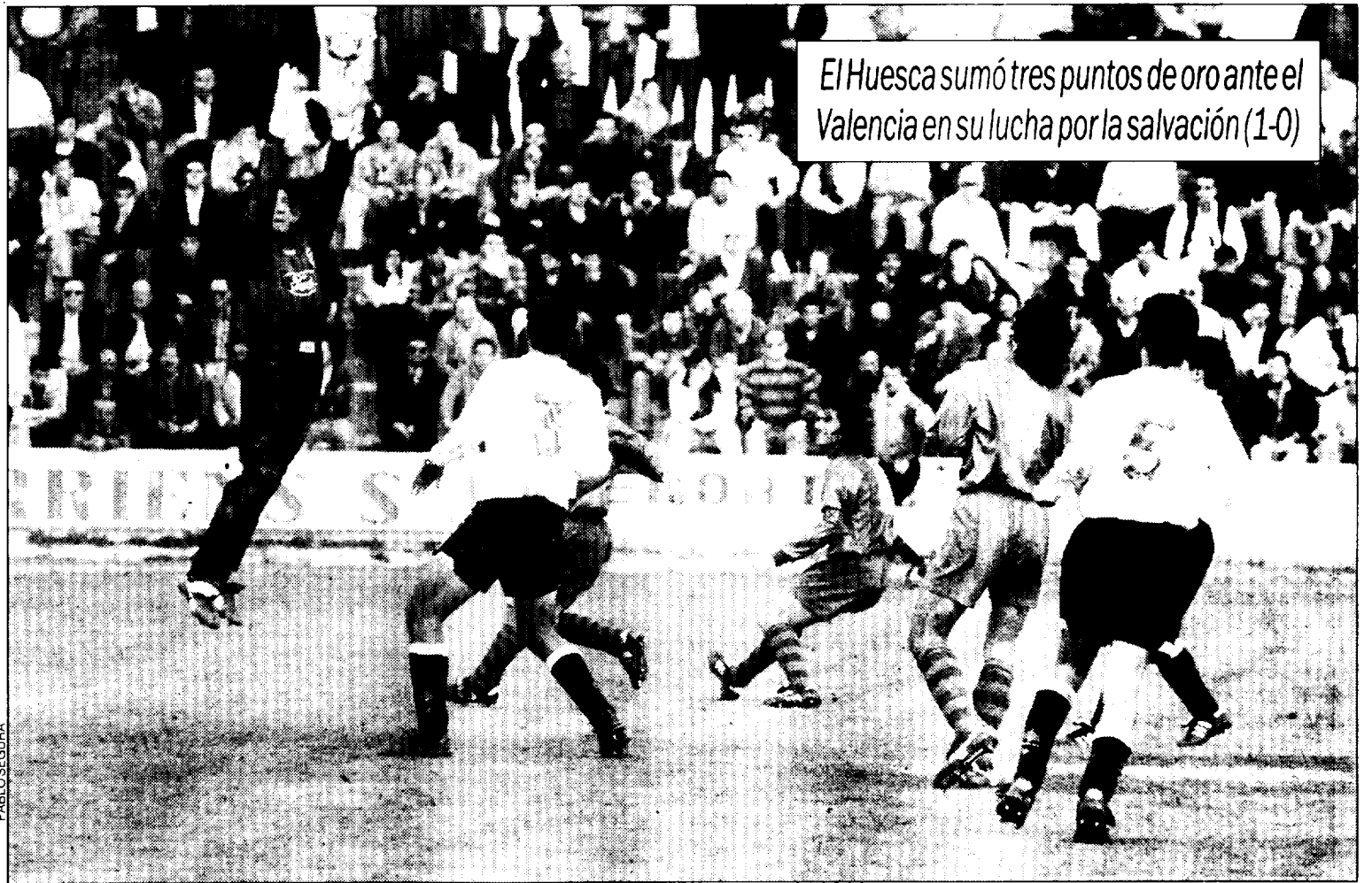
El Huesca sumó tres puntos de oro ante el Valencia en su lucha por la salvación (1-0)