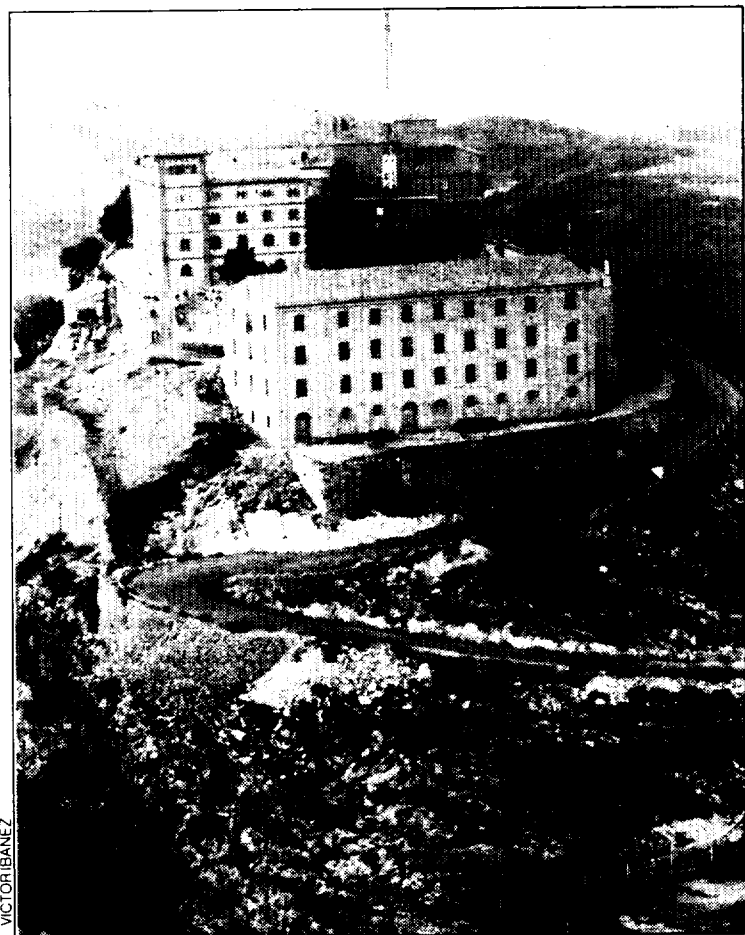
Monasterio de El Pueyo.

Los literanos y, principalmente, los binefarenses se reunirán en la Sierra de San Quilez, donde manifestarán su devoción al Santo y celebrarán la tradicional homilía, que dará paso a las habituales comidas familiares campestres.