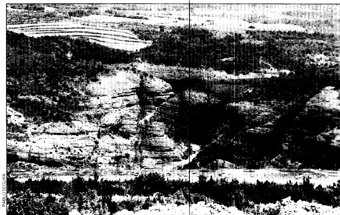
Cañones en el Parque Natural de la Sierra de Guara.

Para el director general es fundamental “contar con una oferta complementaria para aprovechar el tiempo restante del peregrino en nuestra tierra. Por esa razón, me parece importante que haya otros productos turísticos alternativos” . En cualquier caso, opina que “el turismo religioso y los cañones natura-