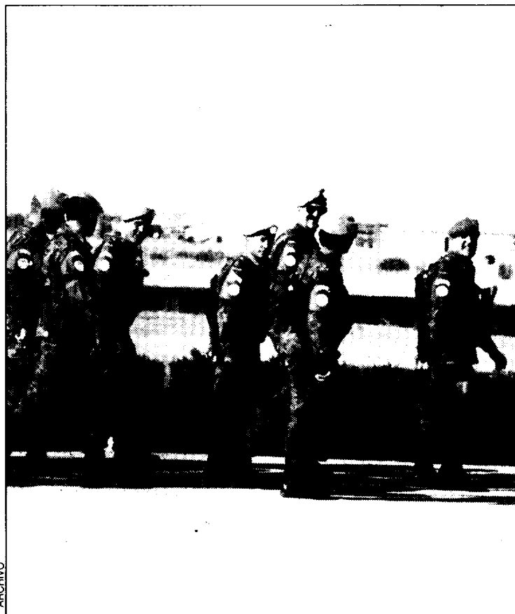
Efectivos de la Agrupación Aragón.

El presidente del Gobierno en funciones, Felipe González, y el ministro de Defensa, Gustavo