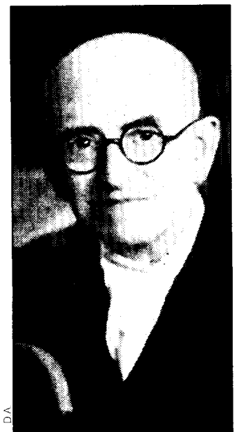
Manuel de Falla

"El amor brujo" es la obra más genial de Falla, a la que el compositor da una gran originalidad en todo momento, empezando por el prelude, muy inquietante, en la caverna de Candelas. Comienza con una canción de amor que se interrumpe con la llegada del espectro, que da lugar a una serie de "precipitaciones", que desvanecen la melodía cálida y dan paso a una música jadeante, que