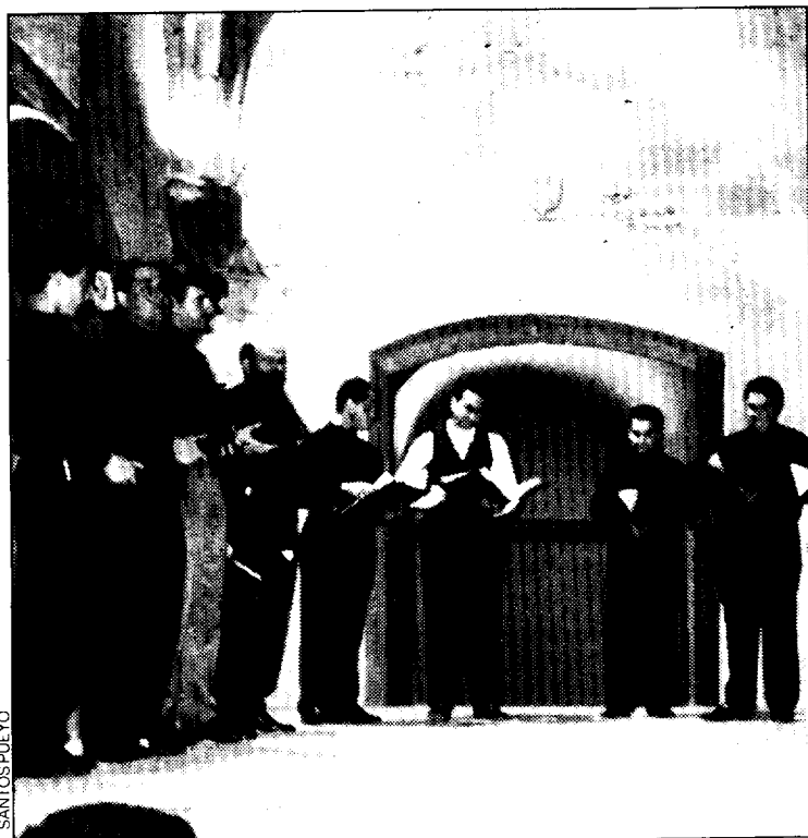
Conjunto vocal "Ecce quam bonum".

"Ecce quam bonum" puso en el atril "La Oración de la Iglesia al atardecer", seguida de Vísperas y Completas para no interrumpir la oración vespertina. La exposición de los motivos de la oración fue muy animada y amena. Aparte de las intervenciones del coro interpretando gregoriano puro; el contratenor, acompañado por un pequeño órgano, hizo una gran demostración llegando a momentos verdaderamente atractivos con la interpretación de las notas agudas con gran limpieza. Sorprendió especialmente su voz en