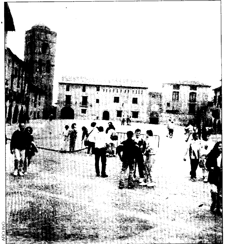
Vista de la plaza de Ainsa.

Alrededor de ochenta stand, distribuidos en el recinto del castillo medieval de la localidad de Ainsa, mostraron al público una oferta variada de productos de distintos sectores, como el ganadero, alimenticio, automovilístico, artesanal, etcétera.