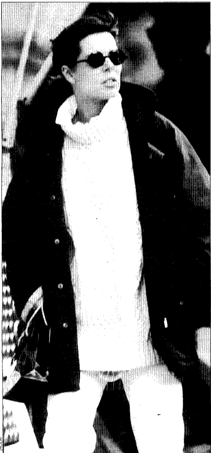
Carolina de Mónaco piensa en boda.

da y hoy por hoy puedo tener hijos sin tener que recurrir a esos adelantos de la ciencia, añade Rocío Jurado. En unas declaraciones que publica "Lecturas", Rocío Jurado, que está a la espera de obtener la nulidad de su matrimonio para casarse con el torero José Ortega Cano, manifiesta que le gustaría tener un hijo con su nuevo amor, pero de forma natural y si no pudiera ser así, se plantearían la posibilidad de una adopción.