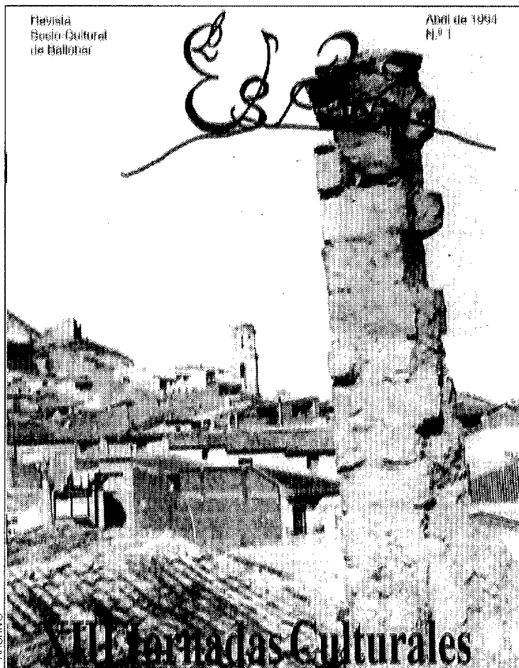
Portada de la nueva revista socio-cultural.

"El año internacional de la familia", que se celebra este ejercicio, el día 21, y "Las alergias", el día 22 de abril, serán otras de las charlas programadas. El día 23, Día del Libro, la biblioteca municipal se traslada a las calles.