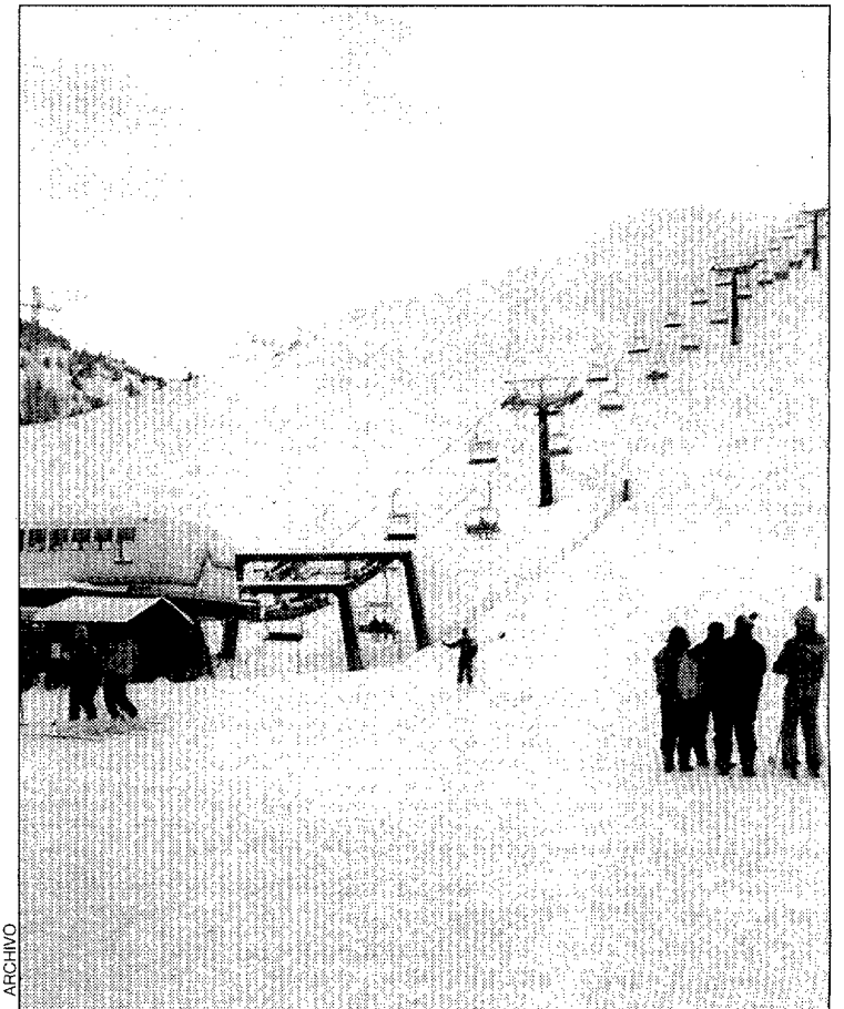
Estación de Cerler

El balance de esta temporada en la estación ribagorzana ha sido muy positivo. Según los datos oficiales que se barjan, la estación ribagorzana ha registrado un crecimiento del 20 por ciento de esquiadores respecto a la anterior. Las mejoras en cinco pistas -Ampríu, Gallinero, Lavert, Cogulla y Farnuserals- y la inniva-