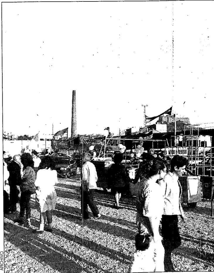
Fercomex prepara su próxima edición

A juicio de los organizadores, "exponer en FERCOMEX no es caro, pues cobramos 36.000 pesetas por nueve metros cuadrados en el interior de los pabellones y 40.000 pesetas por cien metros cuadrados en el exterior, asegurando al cliente que durante los cuatro días recorrerán el recinto no menos