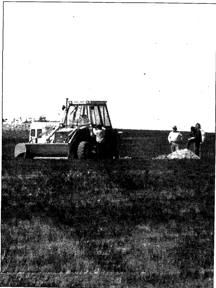
Un momento de los trabajos que comenzaron ayer en la zona de Puilatós.