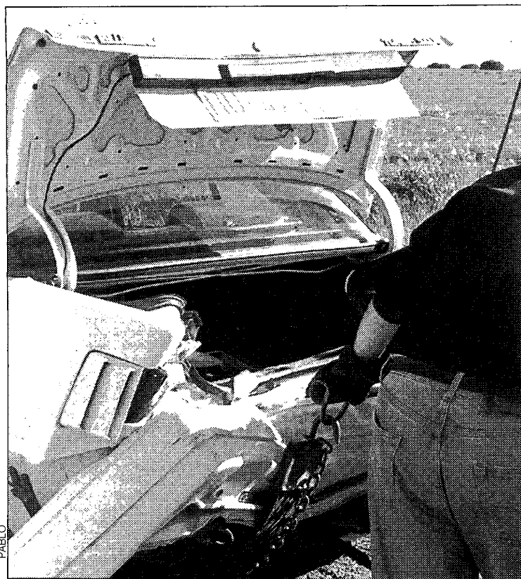
Aspecto del maletero de uno de los coches tras la colisión