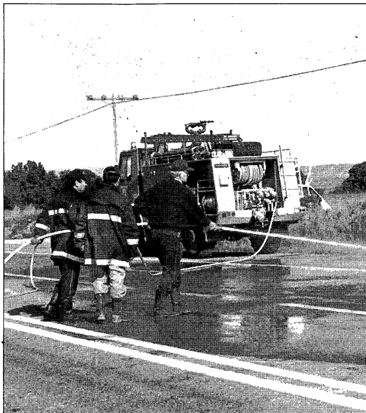
Los bomberos limpiaron la calzada tras el choque

Un camión embistió contra la cola de vehículos provocada por unas obras en la carretera N-330