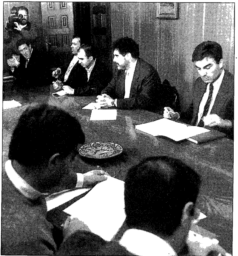
A la izquierda, vista de las obras del pabellón. A la derecha, foto de archivo de una reunión de todas las partes implicadas.

can los documentos o Intemac certifique que los materiales son seguros.