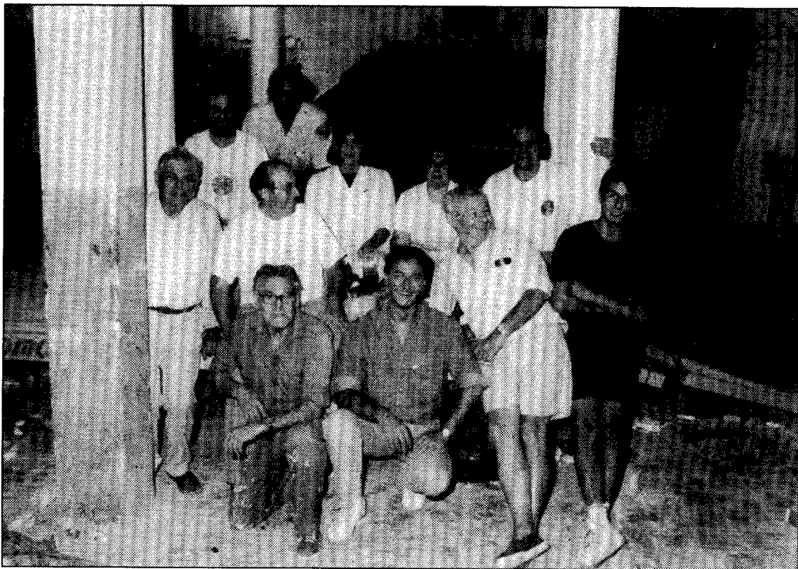
Grupo encargado de la construcción de carrozas para la cabalgata