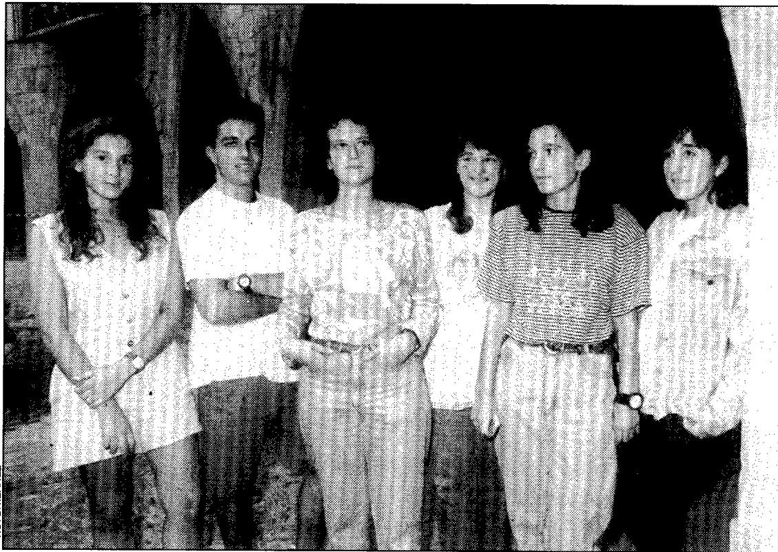
Algunos repatanes de las fiestas de Graus

Antiguamente, la Cofradía recogía especies para ayudar a los más necesitados en épocas de mala cosecha. En la actualidad, todos los donativos que recibe se destina a los gastos de la Iglesia.