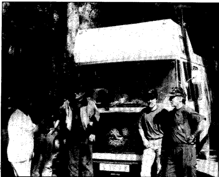
Numerosos jóvenes participaron en la "Caza del Zorro"

En Huesca hay alrededor de 2.300 licencias registradas y ACERIC cuenta con unos trescientos socios