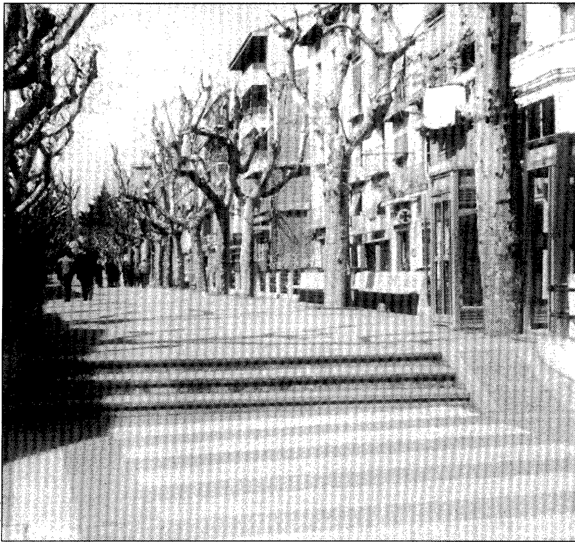
Vista de Barbastro