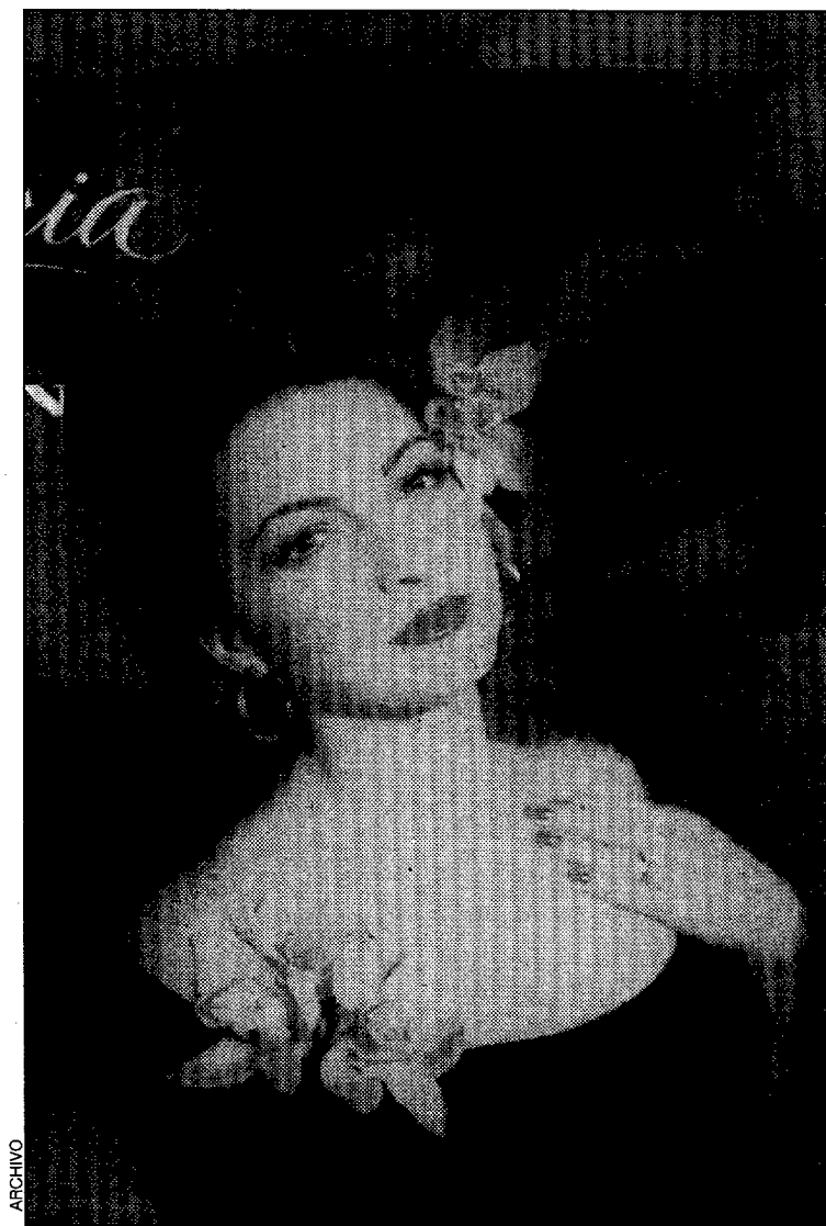
Portada del disco de Gloria Estefan, "Mi Tierra"

En 1989 se editó su tercer álbum, "Cuts Both Ways", que de nuevo incluía temas de enorme impacto, como la balada "Don't Wanna Lose You", o el energético "Oye Mi Canción". Siendo a partir de este álbum que Gloria comparece en solitario en la portada, consiguiendo realizarse el sueño de su hábil marido, productor y representante, que presenta así con éxito ante el público a Gloria como una estrella individual. Todo va fenomenal, sin embargo, en la macrogira que llevan a cabo por los USA, un grave accidente de tráfico acaeció el 20 de marzo de 1990 en Pensilvania, corta la buena racha, provocando a Gloria graves heridas en su espalda, que en un principio hacen incluso dudar de su posible recuperación. Afortunadamente tras larga recuperación, en enero del 91 volvía a la carga con su cuarto "Into The Light", consiguiendo un triunfal regreso, gracias