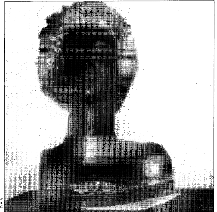
Busto que formará parte de la nueva escultura