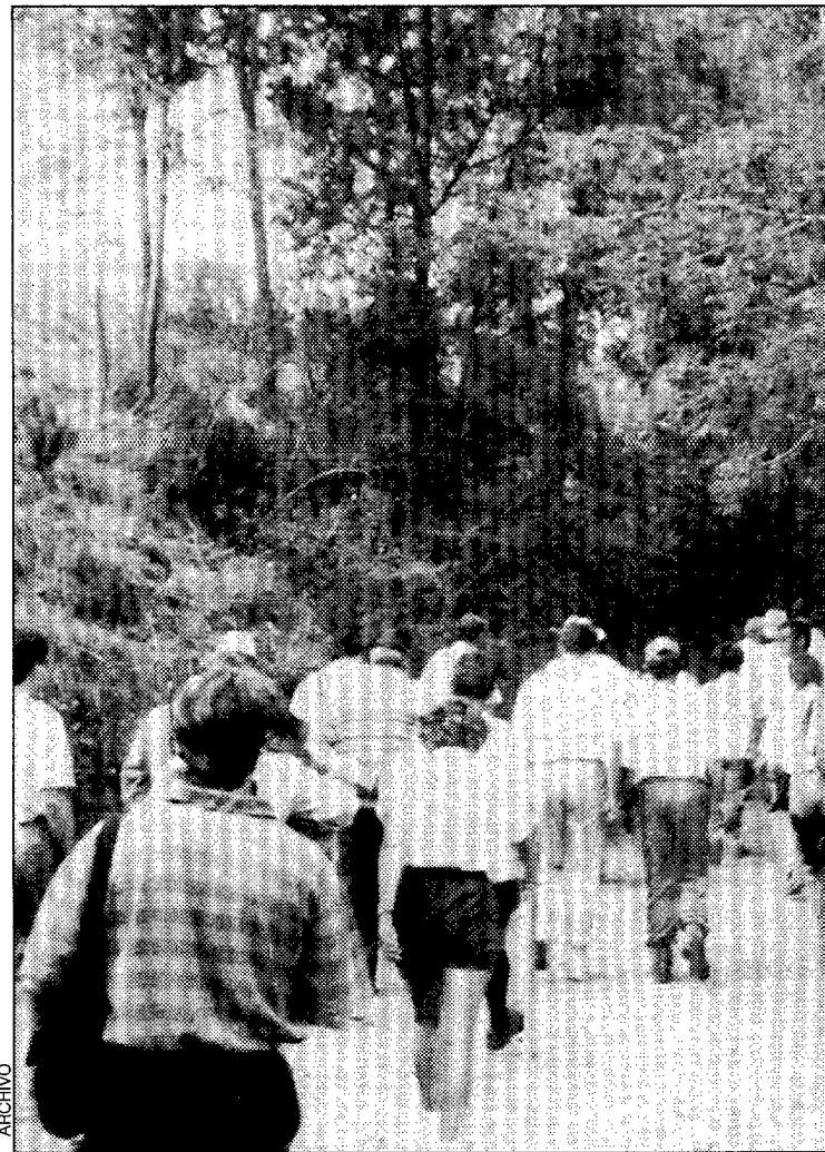
Deportes como el senderismo, cada día con mayor auge