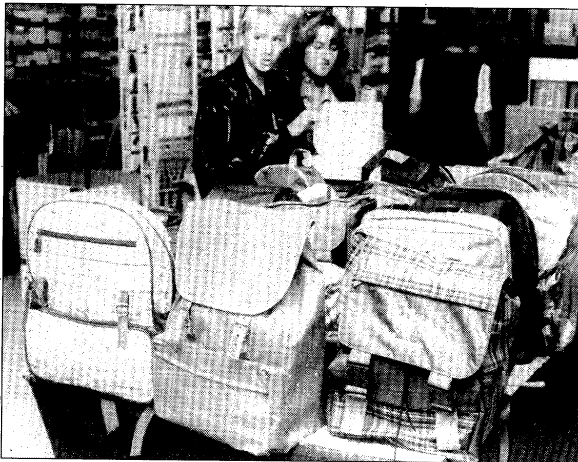
El material escolar se adapta a todos los gustos y bolsillos