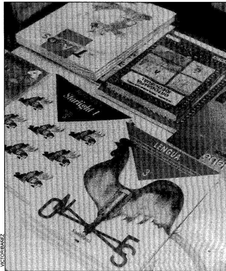
El aprendizaje de idiomas es prioritario

Los adultos forman también parte importante del alumnado de idiomas. Las salidas, los viajes, y la misma necesidad de