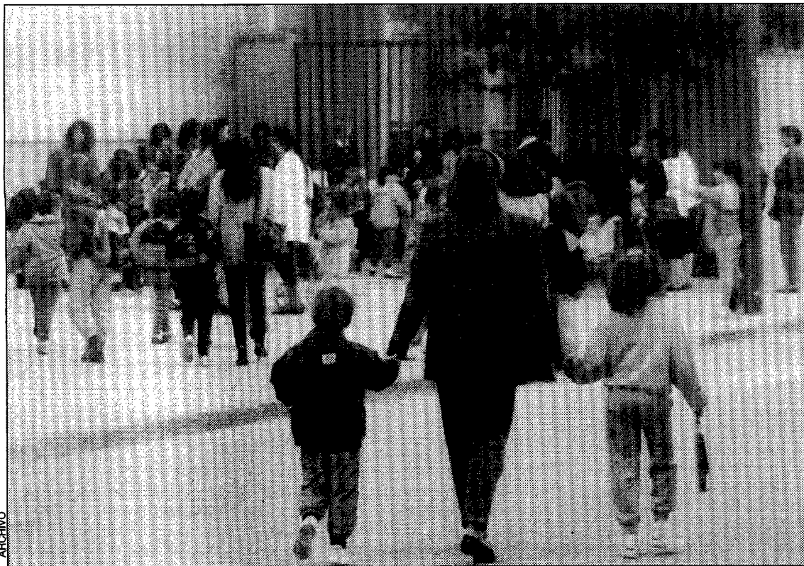
Septiembre significa volver a las aulas

Por último, las recuperaciones y los repastos, son un capítulo importante y complejo, dadas las numerosas materias que necesitan llegar a dominar los alumnos, algo que no siempre se logra en el ámbito escolar, por lo que es necesaria una ayuda complementaria y lo más individualizada posible. El estudio requiere dedicación. Como cualquier tarea humana, sea grande o pequeña, hay que emplearse a fondo para lograr los mejores resultados. La vida es un continuo aprendizaje, un eterno volver al "cole".