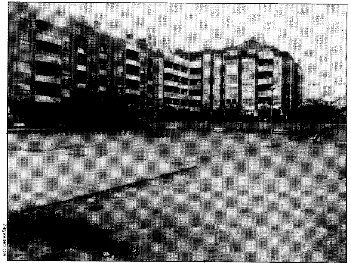
Aspecto de la plaza interior de Los Olivos

No obstante, se pretende conseguir una salida definitiva a este tema proponiendo algunas soluciones alternativas. Entre estas, la Asociación de Vecinos considera que podría edificarse un centro cívico para activar la vida social y