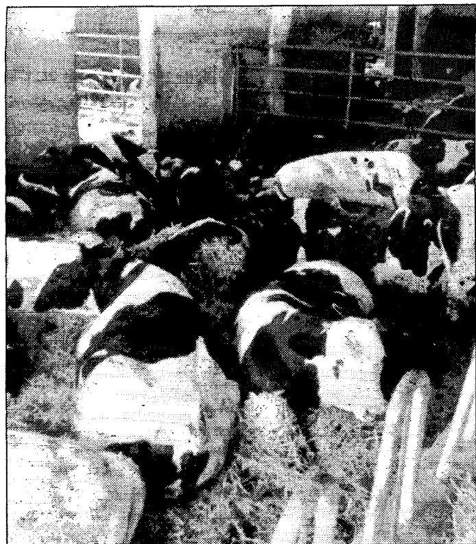
El sector lácteo altoaragonés pide medidas concretas

Reunión de APLA y sectorial de Jóvenes Agricultores