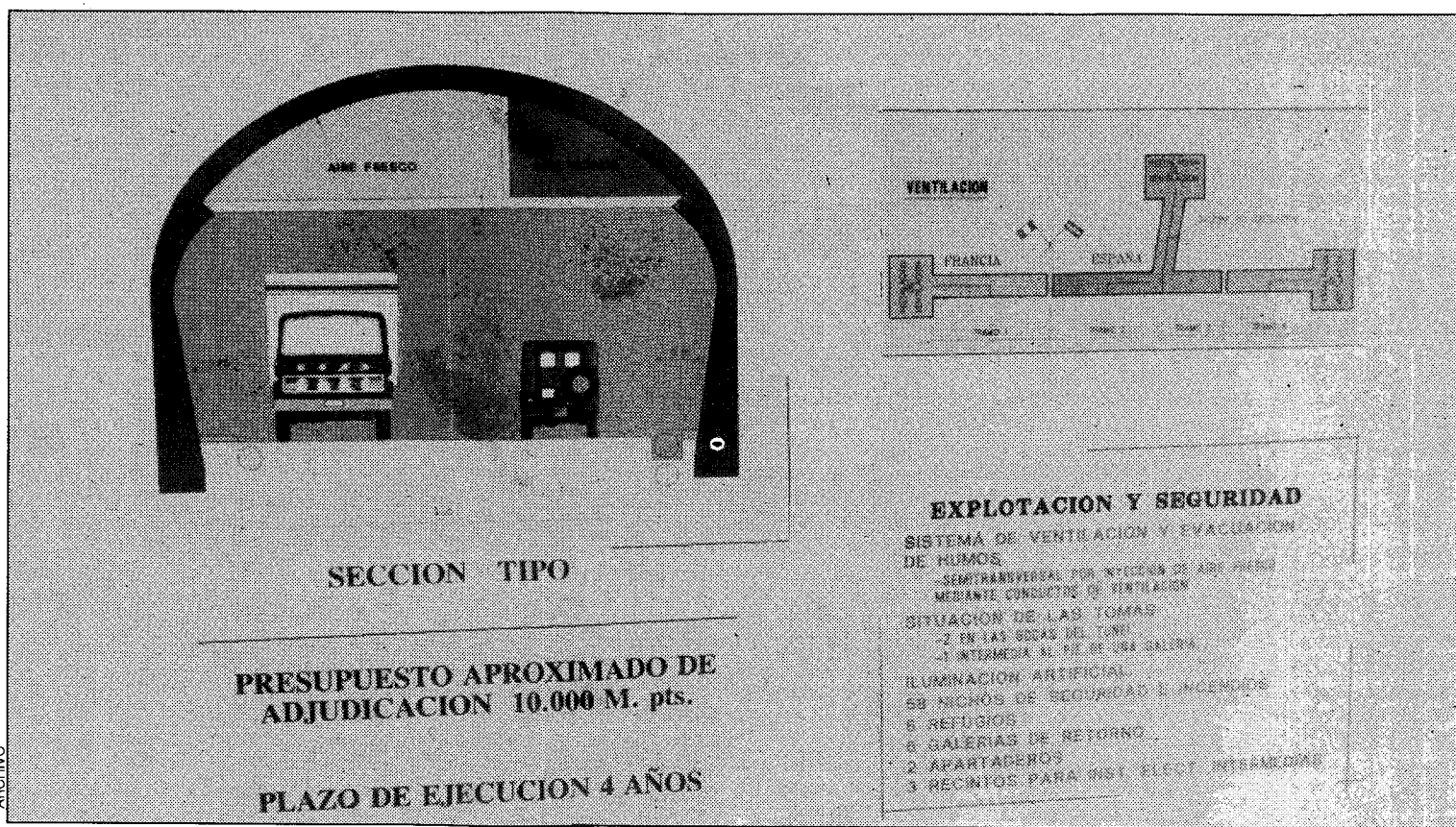
Sección tipo del túnel carretero del Somport

Sin embargo, de momento el Ministerio de Obras Públicas y Transportes no ha acogido ninguna de estas posibilidades e insiste en verter los residuos sobre los campos de Orbil según algunos de los afectados. El Ministerio de Obras Públicas y Transportes fue aplazando la fecha de expropiación de las tierras y propuso en última instancia el próximo 2 de septiembre como fecha tope, lo que ha motivado al resolución por parte de los vecinos de movilizarse durante la primera semana de