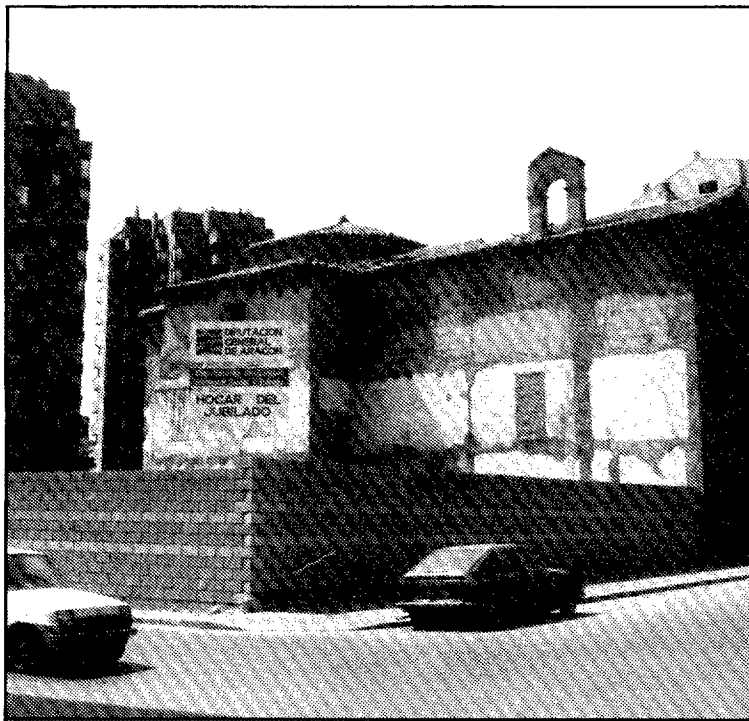
Solar de las Capuchinas