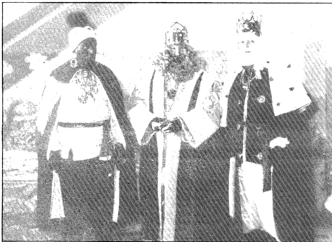
Sus Majestades ya se encuentran de camino para la fecha más señalada

Los Reyes Magos visitarán el día 5 a los niños altoaragoneses