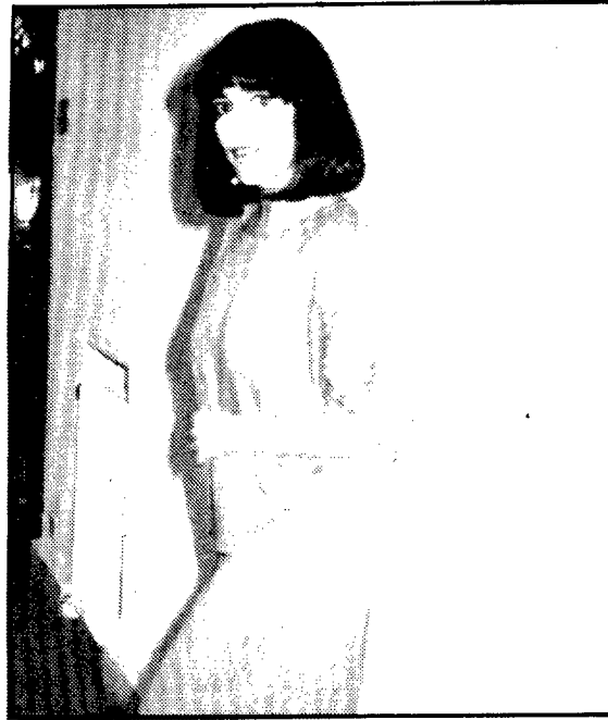
Almodóvar y Carmen Maura, un dúo que funciona

vios», de Pedro Almodóvar, y la que produjo mayor cantidad de silbidos y aplausos simultáneos fue «La leyenda del santo bebedor».