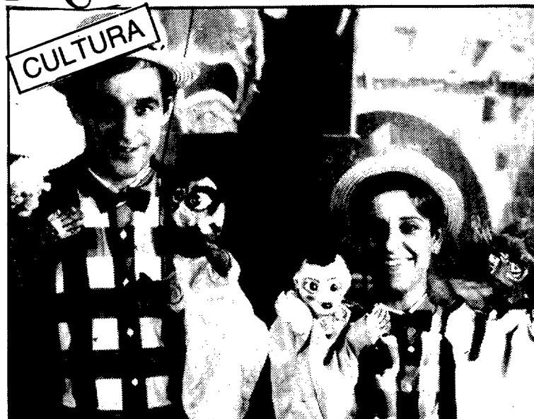
Literano del año: Titiriteros. Diploma: Asociación estudios etnológicos Benito Coll y Escuelas Pías de Peralta

El premio «aliaga» recae en esta ocasión, en un medio de comunicación que por escaso lo es más en la Litera, e influye de una forma alarmante en la desculturización de lo aragonés; de todas formas, este premio a lo negativo no quiere ser más que un toque de atención.