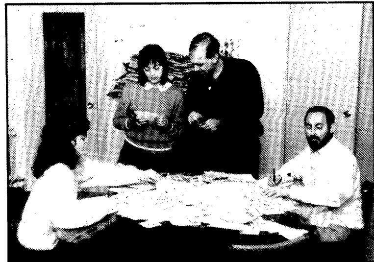
Un momento del escrutinio de los votos en la redacción de la emisora