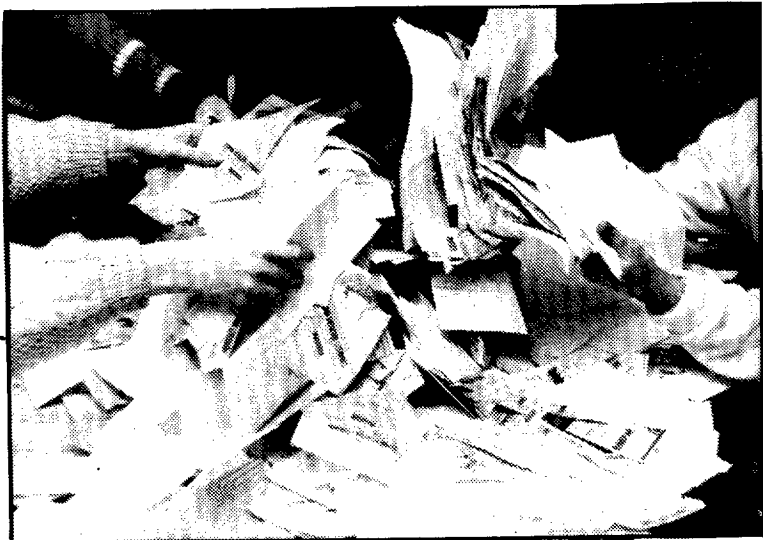
Más de 35.000 votos llegaron hasta la redacción de Radio Binéfar