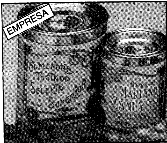
Literano del año: Frutos Secos Zanuy Diploma: Fribin y Sallen Aviacion

Simultánea igualmente su actividad como colaborador habitual en las publicaciones «La voz de la Litera», en la sección por los caminos de la Litera, y en los Cuadernos Altoaragoneses, con «DIARIO DEL ALTOARAGON», además de colaborar en varias ocasiones con EL SEMANAL, este es un pequeño esbozo del primer «Literano de honor».