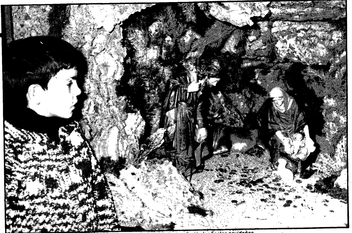
Los niños viven con sentimiento e ilusión las fiestas navideñas

Dentro de la Navidad se celebra la fiesta de la Sagrada Familia, que recuerda los compromisos adquiridos en el matrimonio. María, José y el Niño son paradigmas del papel que la madre, el padre y los hijos tienen que desempeñar en el hogar.