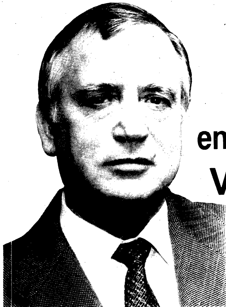
D. ENRIQUE SANCHEZ CARRASCO (alcalde de Huesca)